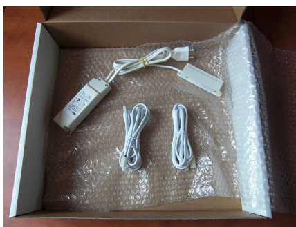
Éléments en sous-couche : 1 Transfo 100W (longueur câble d'alimentation 1400mm) 2 câbles de Longueur 2 000mm chacun