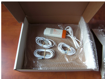
Éléments en sous-couche : 1 Transfo 120W (longueur câble d'alimentation 1400mm) 3 câbles de Longueur 2 000mm chacun