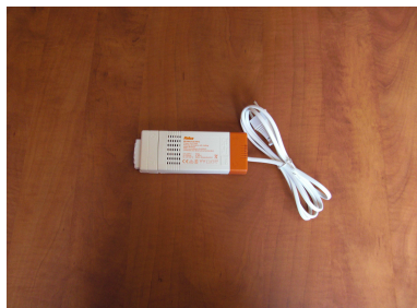
Transfo 120W longueur câble d'alimentation 1400mm