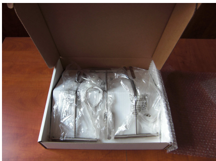
Ouverture de la boîte de 3 luminaires 1 set de 3 spots (3 x [2 x 20])