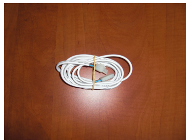
Câble connecté du luminaire au transfo longueur 2 000mm