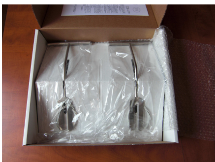
Ouverture de la boîte (2 luminaires) 1 set de 2 spots (2 x [2 x 20])