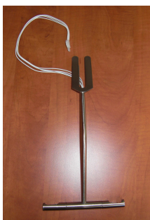
luminaire "Line" longueur câble ~400mm